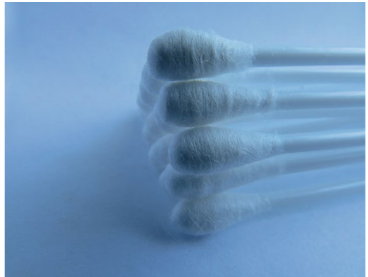
Biometrische preventie van hiv begint zijn vruchten af te werpen.