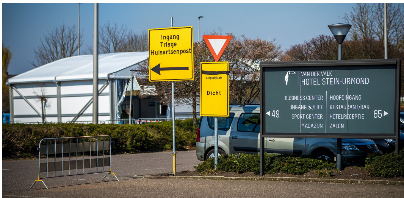
In de eerste golf was sprake van een enorme overcapaciteit in het Coronacentrum Urmond.

was PCR (polymerase chain reaction)-diagnostiek voor SARS-CoV-2 slechts beperkt beschikbaar en stond men voor de vraag hoe optimale en veilige zorg voor deze patiënten eruit moest zien. 2 In Limburg zetten samenwerkende zorgorganisaties met het oog op een mogelijk zeer grote stroom aan COVID-19-patiënten in zeer korte tijd Coronacentrum Urmond op. 3 Het betrof een bovenregionale samenwerking tussen thuiszorg, zorg- en verpleeghuizen, huisartsen(posten), ziekenhuizen, apothekers, de meldkamer, het Netwerk Acute Zorg Limburg (NAZL), de GGD, de GHOR, de Veiligheidsregio Zuid-Limburg en defensie. Met de toolkit van de Landelijke Huisartsenvereniging (LHV) werd geprobeerd de patiëntenstroom te scheiden, efficiënt te werken en de zorg in de hoogste GHOR-fase te waarborgen (zie het [kader] voor Stadium 4 uit de in de toolkit opgenomen tabel). 4 We beschrijven het opschalingsproces, de belangrijkste succesfactoren en verbetermogelijkheden, en de patiëntenpopulatie die in het Coronacentrum werd beoordeeld.