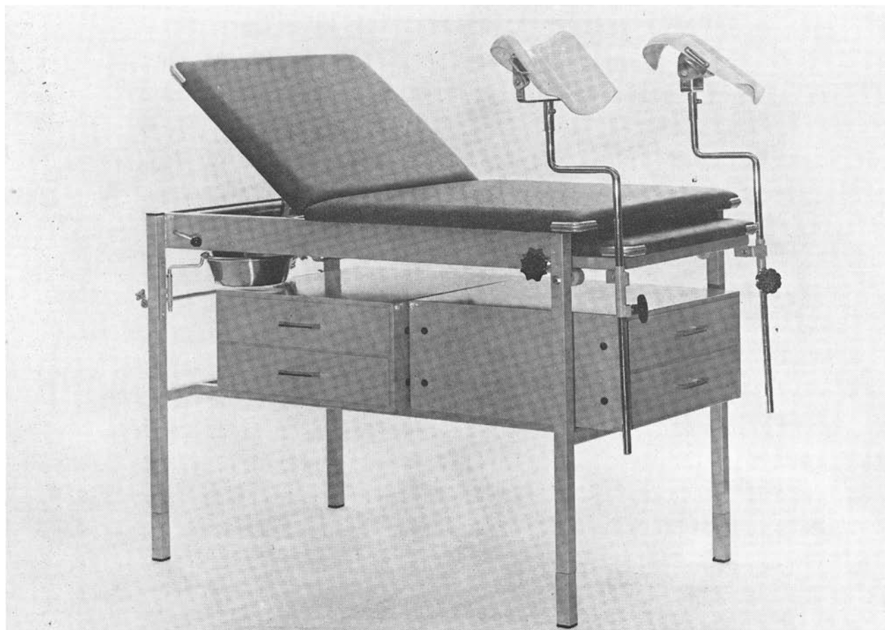
Figuur 3. De Mini-Multo N.H.G.-bank. Standaarduitvoering, aangevuld met een schaalhouder met roestvrij stalen bakje, laden-unit zijkant en voeteneinde en kniesteunen.

Deze standaarduitvoering is met verscheidene aanvullingen te vervolmaken. Halverwege de poten kan een plank in het frame worden gelegd, om er allerlei dingen op te plaatsen, die men anders op de grond zet ( figuur 1 ). Deze ruimte onder het ligvlak meenden wij echter beter te kunnen benutten en wel voor het opbergen van onderzoeken en behandelingsinstrumentarium, dat men aldus veel gemakkelijker bij de hand heeft dan in een instrumentenkast of op planken boven de bank. Hiervoor werden twee kasten gemaakt, elk met twee laden, om in het frame te plaatsen: één aan de zijkant van de bank met vakverdeling voor instrumentarium, verband enzovoort, ten behoeve van algemeen onderzoek c.q. behandeling en één aan het voeteneinde zonder vakverdeling voor gynaecologische benodigdheden, nierbekkens en dergelijke ( figuur 2 ). Verder is naast de schouder een plank aan te brengen om bloeddrukmeting bij