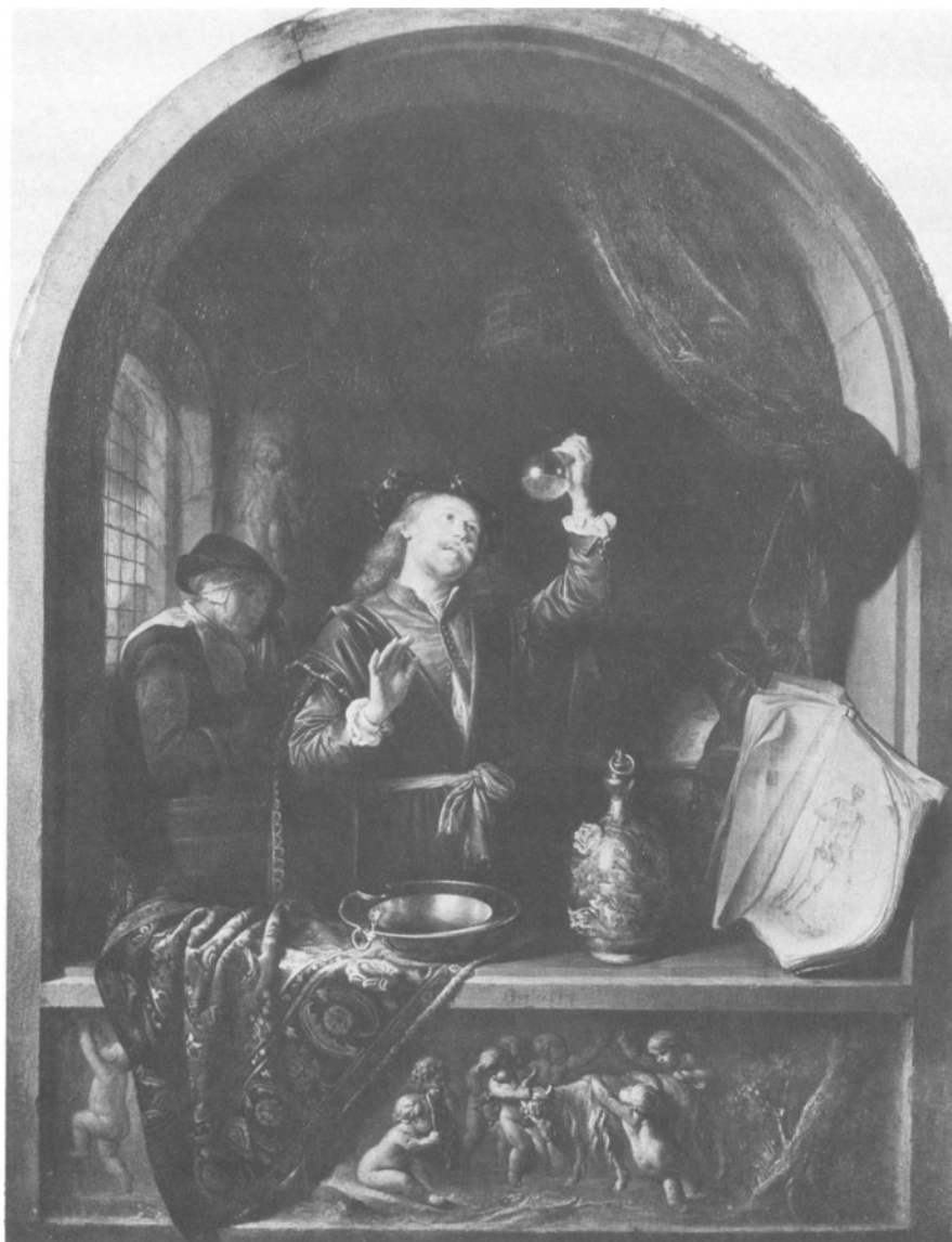
Figuur 2. Gerard Dou, De arts , Kunsthistorisches Museum, Wenen.

de voetwassing van Christus, een scène die symbolisch is voor de geestelijke reiniging.