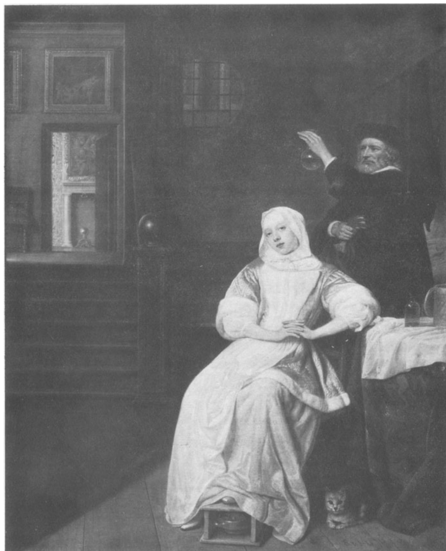
Figuur 4. Samuel van Hoogstraten, De zieke dame , Rijksmuseum, Amsterdam.

De dokter op een schilderij van Jan Steen in de Stichting Willem van der