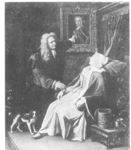
Figuur 6. Cornelis de Man (?), Doktersvisite , verblijfplaats onbekend.

Hetzelfde geldt voor de Doktersvisite van Jan Steen te Philadelphia (figuur 7), waar de dokter het geluk heeft,