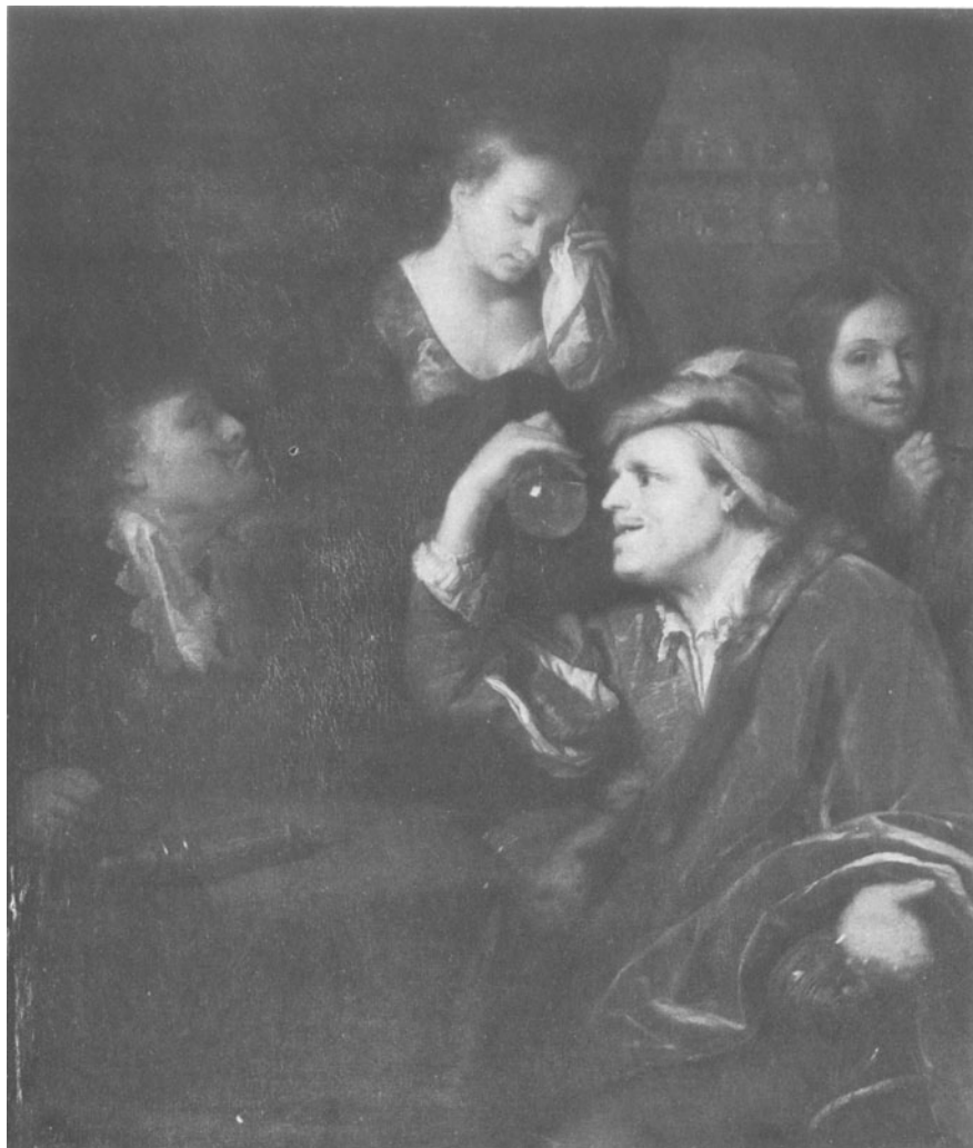
Figuur 3. Gotfried Schalcken, Doktersvisite, Dienst voor 's Rijks Verspreide Kunstvoorwerpen.

bewijzen, dat uyt het water niet gesien en kan worden . . . of een vrouw swaer gaet . . . sulcx uyt het water te oordeelen streckt meestentijt om het gemeen volck te bedriegen.