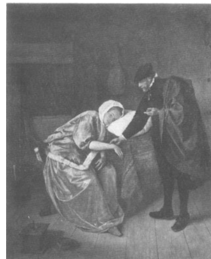
Figuur 8. Jan Steen, De zieke dame , Rijksmuseum, Amsterdam.

nes betreft, komen we tevens iets te weten over de ideeën die bestonden over de arts, de patiënt, de erotische melancholie waaraan de laatste soms leed, alsook over de wijze waarop de mens zich in seksueel opzicht diende te gedragen.