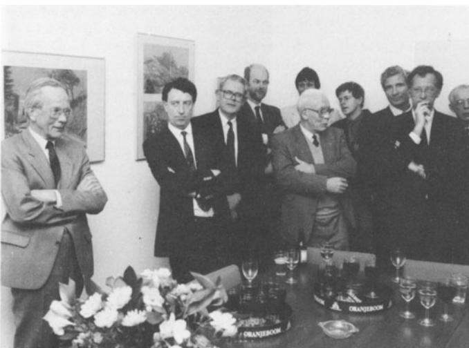
Luisterend naar de voorzitter... Op de voorgrond een drankje, op de achtergrond werk van F. Huygen.