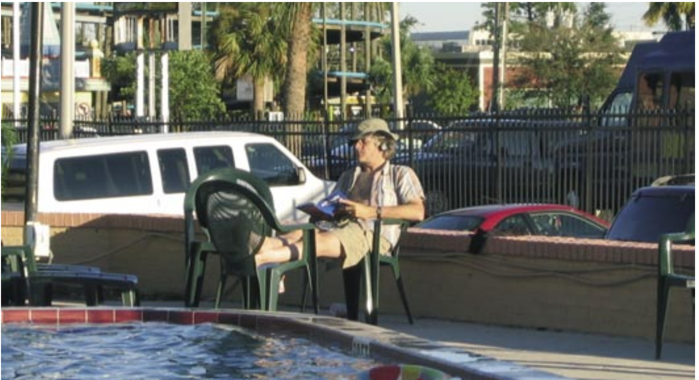
Wonca-congres in Orlando: nascholing buiten de regio